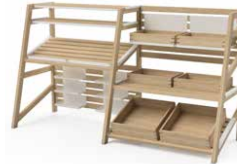
Components setup 4:

3x 8270 2x 2402 4x 8272.01 5x 8271 6x 2403.01 2x 8272.02 2x 2401 2x 2403.02 2x 8273.02