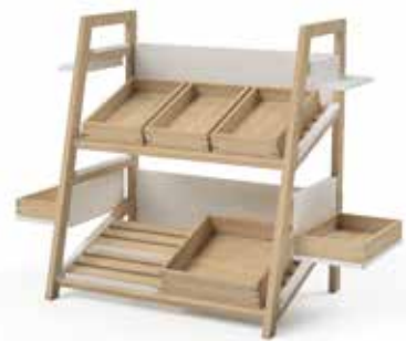
Components setup 1:

Das Buffetregal lässt sich mühelos und ohne Werkzeug aufbauen, anpassen und immer wieder neu arrangieren, um den jeweiligen Anforderungen gerecht zu werden. Alle Elemente sind miteinander kombinierbar und werden einfach eingehängt. Dies ermöglicht einen schnellen Abbau, eine problemlose Handhabung beim Transport und eine platzsparende Lagerung – ein unschätzbare Vorteil in der Gastronomie.