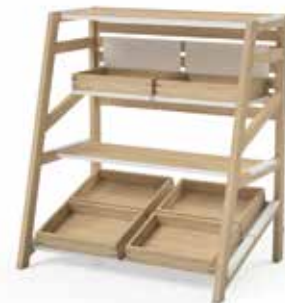
Components setup 2:

2x 8270 2x 2402 5x 8272.01 2x 8271 2x 2403.01 1x 8272.02 2x 2401 2x 2403.02