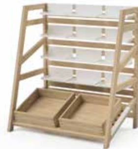
Components setup 3:

2x 8270 2x 2403.02 1x 8271 6x 8272.01 4x 2401 2x 8273.02